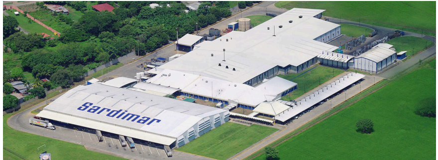
Alimentos ProSalud S.A., Puntarenas, Costa Rica.

Alimentos ProSalud S.A. es una planta procesadora de atún ubicada en Puntarenas, Costa Rica. Su prioridad es centrarse en procesos controlados de alta calidad. La certificación ISO 50001 ha sido un paso importante para mejorar el rendimiento y los indicadores en la caldera.